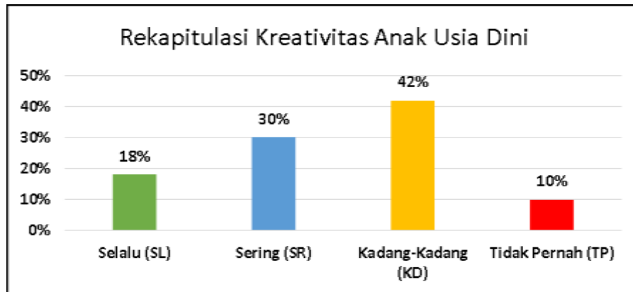
Gambar 2. Histogram Rekapitulasi Distribusi Frekuensi Kreativitas AUD Usia 4 – 5 Tahun

Hasil pengolahan data, dengan menggunakan 16 item pernyataan pada angket yang terdiri dari 5 indikator antara lain: imajinasi yang kuat 3 item pernyataan, berani menyatakan 3 item pernyataan, rasa ingin tahu yang tinggi 3 item pernyataan, mempunyai niat dan percaya diri 3 item, dan inisiatif 4 item pernyataan. Lebih jelasnya berikut histogram dari kreativitas anak usia dini: